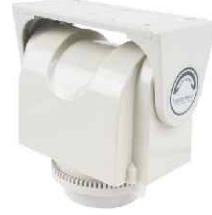
Pan ve Pan/Tilt Motorları