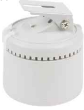
Pan ve Pan/Tilt Motorları