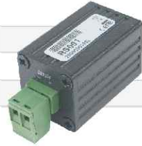
RS 485 Konvertör

Bilgisayar comport üzerinden hareketli kameraları kontrol etmek için kullanılır.