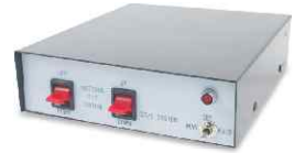
Pan ve Pan/Tilt Kontrol Ünitesi