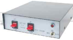
Pan ve Pan/Tilt Kontrol Ünitesi